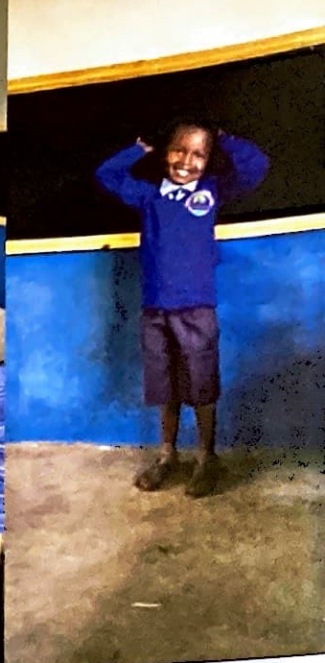
A dalt i a la pàgina anterior, imatges d'alumnes i del centre; a la dreta, els germans promotors del projecte.

En menys de dos anys, i començant de zero, l'associació ha engegat diversos projectes de suport a l'educació de la comunitat Maasai, però sense cap mena de dubte, el projecte que ha marcat la diferència ha estat la construcció d'una escola al centre de la comunitat Ololasurai, al costat d'Enkopiro Camp, en un indret d'enorme bellesa natural, dins d'una zona de protecció de la natura i fauna i a on, fins ara, els nens i nenes no havien pogut gaudir mai d'educació.